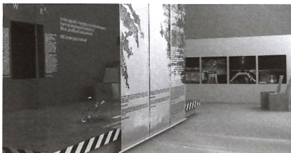
10th Biennale Βενετίας, Ελληνικό περίπτερο. Το Αιγαίο μια διάσπαρτη πόλη