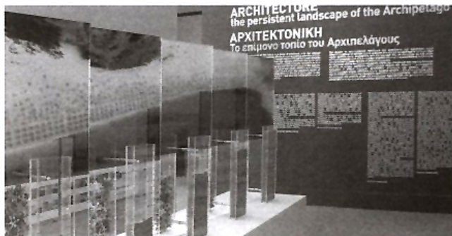
10 n Biennale Βενετίας. Ελληνικό περιπτερό. Το Αιγαίο μια διάσπαρτη πόλη

- Οι εξαναγκασμένες επάλληλες αποδημίες και παλιννοστήσεις επέτρεψαν στο Αιγαίο να υποδεχτεί εγκαίρως ό,τι μπορεί να σημαίνει ετερότητα και