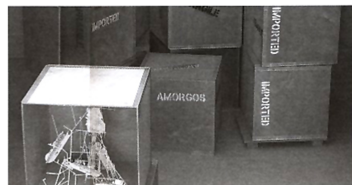
10th Biennale Βενετίας, Ελληνικό περίπτερο. Το Αιγαίο μια διάσπαρτη πόλη