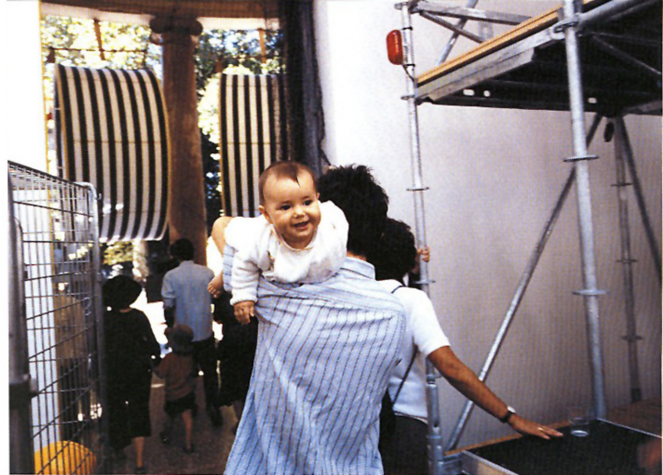
Το γαλλικό περίπτερο, που διέθετε σάουνα και κουζίνα, αποδείχθηκε ιδιαίτερα δημοφιλές σε μικρούς και μεγάλους επισκέπτες.

ματικών κτιομάτων. Να αναδειχθούν προβλήματα που ήδη αντιμετωπίζουν οι σημαντικότερες πόλεις του πλανήτη, από τη Νέα Υόρκη και το Τόκιο μέχρι τη Βομβάη και το Μέξικο Σίτι: μαζική προσέλευση οικονομικών ή πολιτικών μεταναστών, έλλειψη επαρκούς συγκοινωνιακού δικτύου, τεράστια κατανάλωση ενεργειακών πόρων, δημιουργία νέων προαστίων κ.ο.κ. Υπολογίζεται ότι μέχρι το 2050, το 75% των κατοίκων της γης θα ζουν σε πόλεις. Ασχέτως αν η διοργάνωση καταφέρει να προσεγγίσει τα φλέγοντα ▶