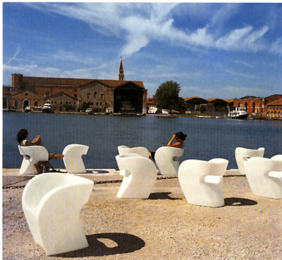
Διάλειμμα για ανάπαυση, μετά την κοπιαστική επίσκεψη στο Αρσενάλε με φόντο τα κανάλια της Βενετίας.