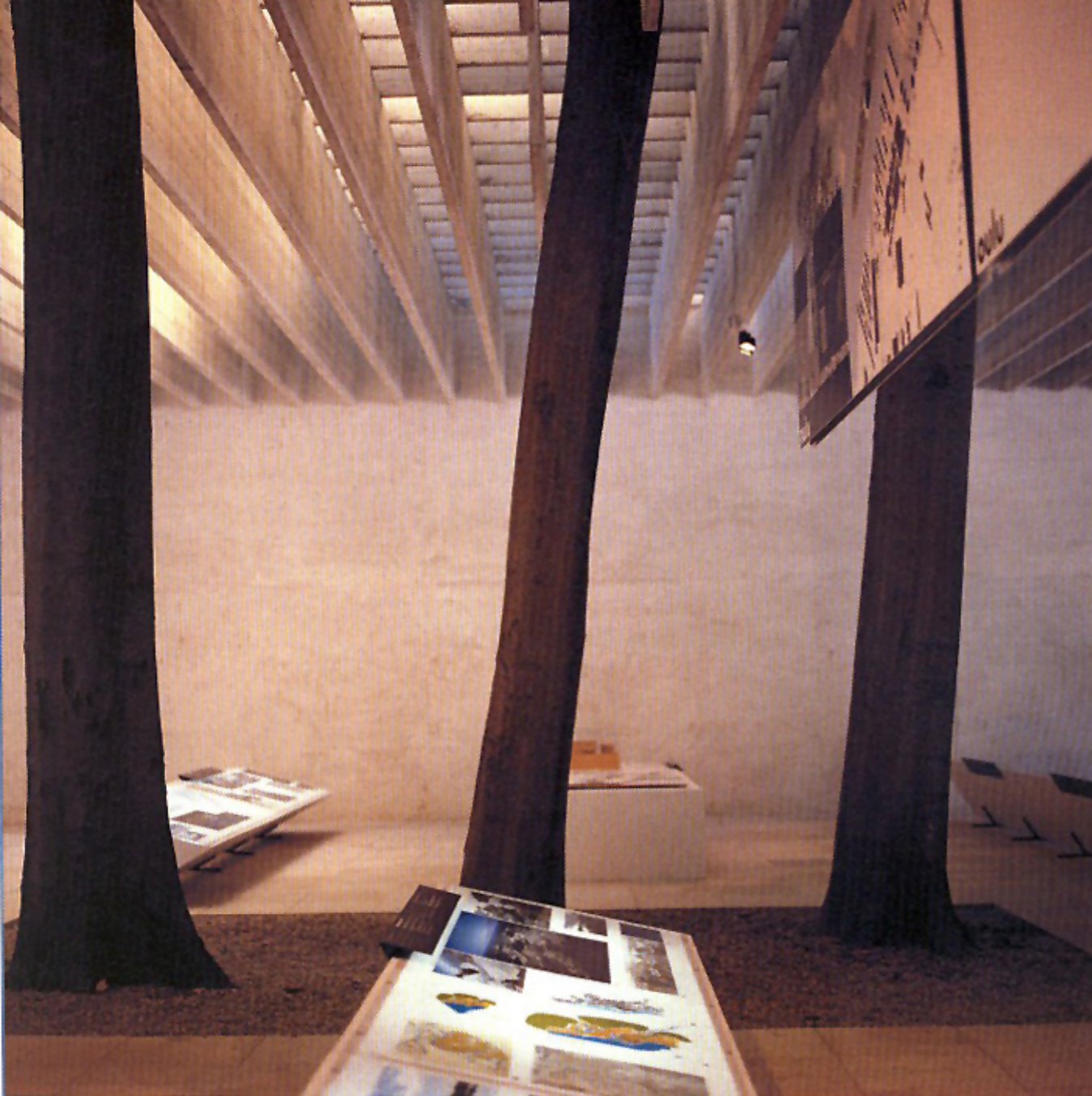
Τρεις σκανδιναβικές χώρες, η Φινλανδία, η Νορβηγία και η Σουηδία παρουσίασαν ένα κοινό πρότζεκτ με τίτλο «αρκτικές πόλεις».

Ζ ούμε στην εποχή των αρχιτεκτονικών σταρ. Τα εμπνευσμένα οικοδομήματα του Φόστερ, του Λίμπεσκιντ, του Ρότζερς και των υπόλοιπων διεθνώς καταξιωμένων συναδέλφων τους, ανανεώνουν το πρόσωπο των σύγχρονων μητροπολιτικών κέντρων και τους προσδίδουν αξία στο χάρτη των ταξιδιωτικών προορισμών. Μαγνητίζοντας, όμως, τα βλέμματα και