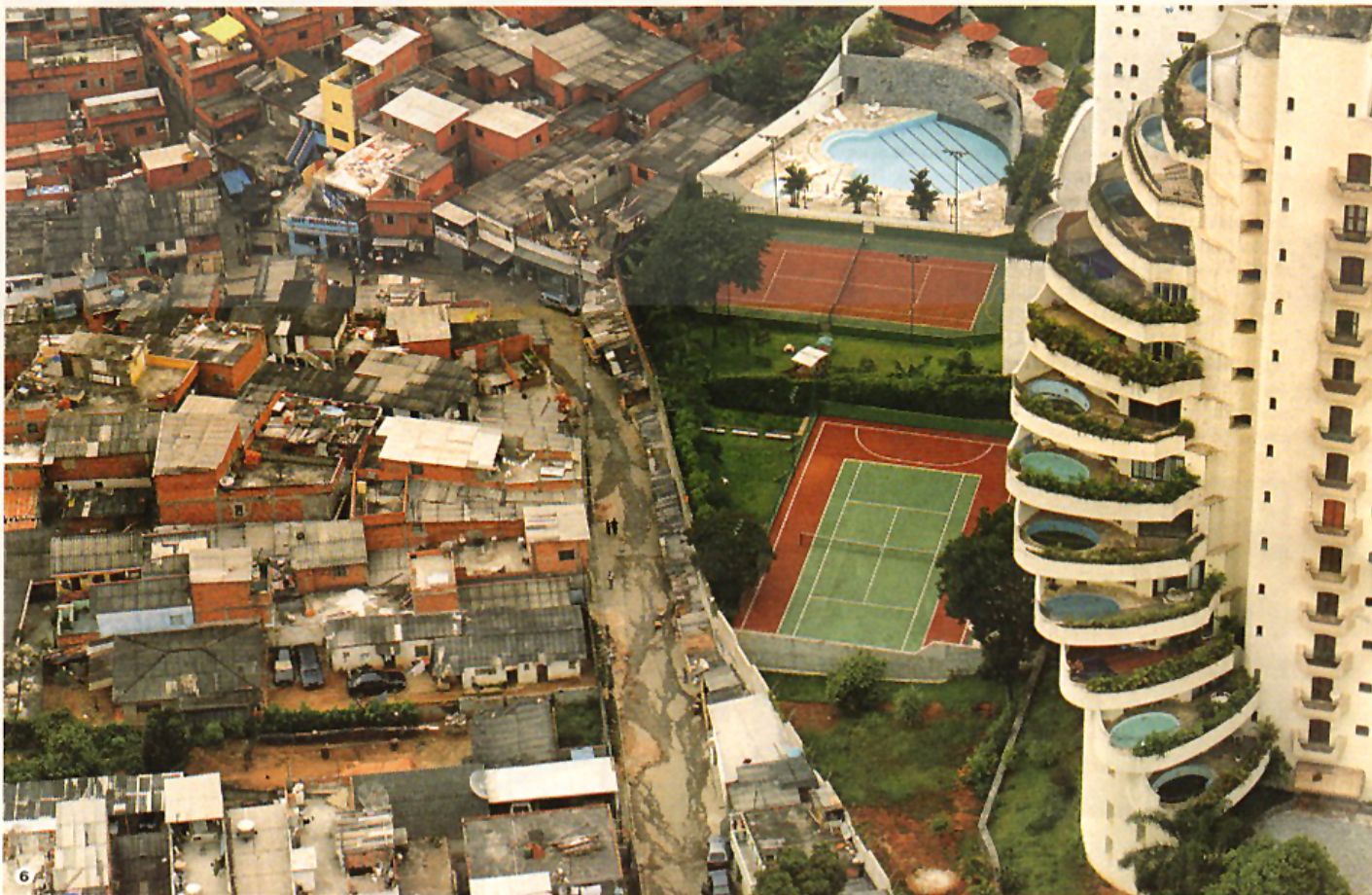
1) Το πάρκο Αλ-Αζάρ στην καρδιά μιας από τις πλέον υποβαθμισμένες γειτονιές του Καΐρου. 2) Το λαβυρινθώδες μετρό του Τόκιο επιτρέπει στο 80% του πληθυσμού του να μετακινείται χωρίς αυτοκίνητο. 3) Η Πόλη του Μεξικού αποτελεί σήμερα μοντέλο «μη δημοκρατικού» πολεοδομικού σχεδιασμού με σοβαρά περιβαλλοντικά προβλήματα. 4) Σύμφωνα με τα Ηνωμένα Έθνη, η Βομβάη θα είναι το 2050 η μεγαλύτερη πόλη στον κόσμο. 5) Η Σαγκάη αναπτύσσεται με ιλιγγιώδεις ρυθμούς για να μπορέσει να απορροφήσει τα εκατομμύρια των ανθρώπων που συρρέουν από την επαρχία. Μέσα σε δέκα χρόνια τα ψηλά κτίρια της πόλης αυξήθηκαν από 300 σε 3.000. 6) Στο Σάο Πάολο η αρχιτεκτονική μεγεθύνει τις τεράστιες κοινωνικές αντιθέσεις.