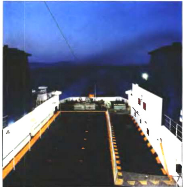
Από την ελληνική συμμετοχή στη 10η Μπιενάλε Αρχιτεκτονικής της Βενετίας: «Τα πρόσωπα των νησιών - Το πρόσωπο των ανθρώπων», μια διδύμη αφήγηση από τους φωτογράφους Στράτο Καλαφάτη (έργο του αριστερά) και Σπύρο Στάβερη (δεξιά).

Στο ελληνικό περίπτερο της Μπιενάλε το Αιγαίο θα παρουσιαστεί μέσα από τις κλασικές προσεγγίσεις «γαλάζιο της θάλασσας», διαύγεια, ακτινωτό φως, άνεση, φύση, αλλά και μέσα από μια πιο σύγχρονη ματιά, που θα εστιάζει πάνω σε κτήρια, κατασκευές και ανθρώπους. Μέσα από φωτογραφίες θα αναδειχθεί η ζωή στο Αιγαίο, τόσο το χειμώνα όσο και το καλοκαίρι, δηλαδή γεμάτο και άδειο από κόσμο αντίστοιχα, ενώ θα υπάρχουν και ηλεκτρονικοί χάρτες και ταξιδιάρικα που εστιάζουν στην εμβυθιστική εμπειρία της πόλης του Αιγαίου, όπου θα καταγράφεται ο διαρκώς μεταβαλλόμενος χαρακτήρας του. Ο τρόπος ανάγνωσης των αστερισμών του