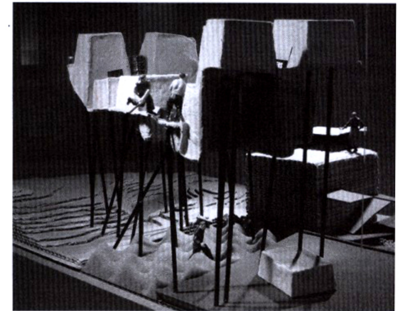
▲ Ζηνοβία Τολούδη - Μαρία Στεφανίδη.