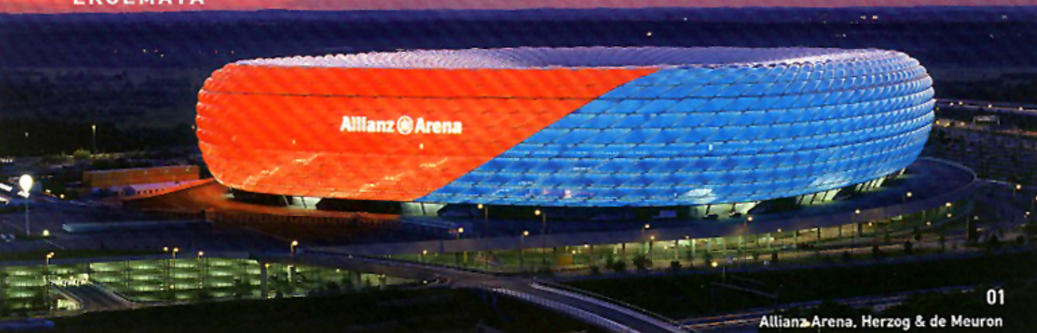
Allianz Arena, Herzog &amp; de Meuron