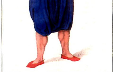
Νούσης, 1804 (από το βιβλίο «Η Θεσσαλονίκη του 18ου αιώνα»)