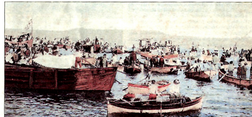
Λειμνοδρομία εν Σύρω (Ιστορία της Ελλάδας του 20ού αιώνα, επιμ. Χρήστος Χατζυγιάννης, τ. Β2, Αθήνα 2003)