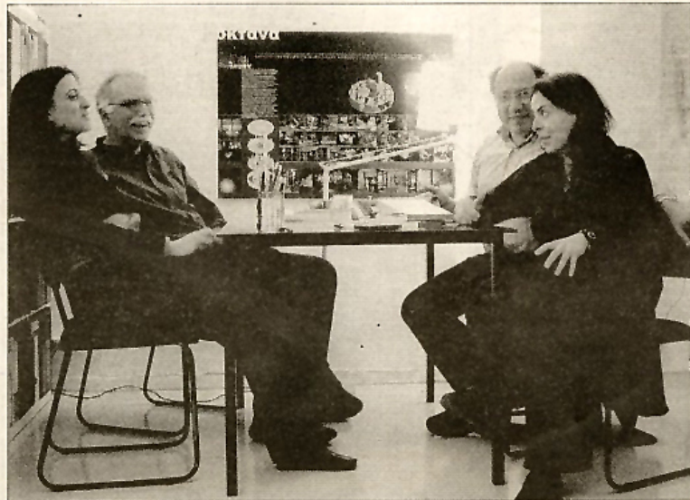
Οι αρχιτέκτονες που ετοιμάζουν την απάντησή μας.

Το σήμα κινδύνου που εκπέμπουν οι πόλεις ακούγεται όλο και πιο δυνατά. Σε μια κρίση για το μέλλον των πόλεων εποχή ο επιμελητής της φετινής Μπιενάλε Αρχιτεκτονικής της Βενετίας κάλεσε τους αρχιτέκτονες όλου του κόσμου να διερευνήσουν το θέμα "Πόλεις - Αρχιτεκτονική και κοινωνία".